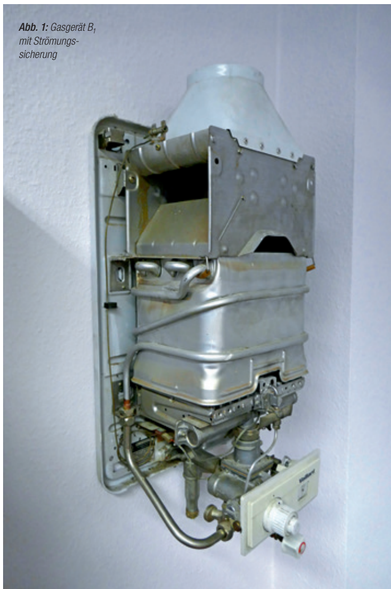
Abb. 1: Gasgerät B 1 mit Strömungssicherung

von: Holger Schröder (Netze Duisburg GmbH), Jürgen Klement (Ingenieurbüro für Versorgungstechnik), Georg Maatsch (Energienetze Bayern GmbH & Co. KG) & Kai-Uwe Schuhmann (DVGW e. V.)