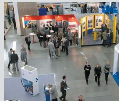
Auf der gat 2003 in München fand auch die offizielle Übergabe der Akademie-Zertifikate im Bereich Betriebswirtschaft statt.

fig damit einhergehenden Veränderung der Unternehmensorganisation müssen sich die technischen Fach- und Führungskräfte in ihrem beruflichen Umfeld neuen Herausforderungen stellen. Mit