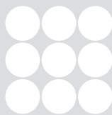
Prüfung und Zertifizierung