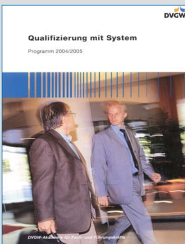
Das neue Programm 2004/2005 der DVGW-Akademie liegt vor.