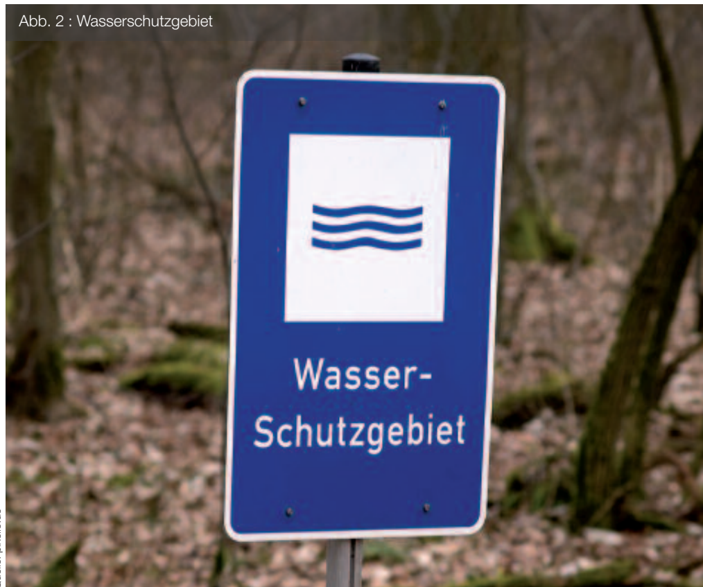
Abb. 2 : Wasserschutzgebiet

(1) Die Gewässer sind nachhaltig zu bewirtschaften, insbesondere mit dem Ziel,