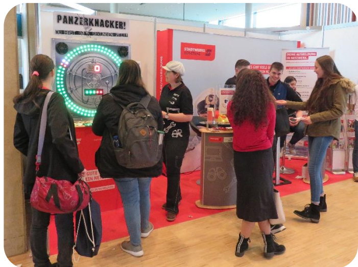
Abbildung 4: Messestand der Stadtwerke Konstanz bei den Jobdays, © Stadtwerke Konstanz GmbH

Alles: Planung Messestand, Beschaffung Giveaways und Betreuung am Tag der Messe.