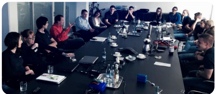
Abbildung 1: Planung eines Videoclips

In moderierten Workshops lernen die Azubis die Grundzüge des Drehbuchschreibens, der Kameraführung, dem Schnitt und der Projektarbeit kennen. Ein finanzieller Rahmen für z.B. Schnittprogramme oder Handymikrofone wird festgelegt. Die Szenen für einen Videoclip werden geplant, Requisiten und Orte gesucht. Das Filmen wird mit dem eigenen Smartphone durchgeführt und der Schnitt mit der Software „Magix“.