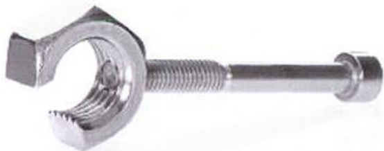
Abbildung 6: Die Schüler fertigen als Erinnerungsstück einen Flaschenöffner

Ab dem ersten Tag und für das komplette einwöchige Praktikum wird dem Schüler ein Azubi zur Seite gestellt. Der Azubi ist für diese Woche Begleiter und Ansprechpartner für den Schüler. Für den Schüler wird somit eine Situation geschaffen, die es ihm erleichtert sich in den Ausbildungsberuf einzufühlen. Der Schüler ist während des Praktikums z.B. beim Außeneinsatz mit den Monteuren unterwegs und erhält Einblicke in die Versorgungsanlagen des Unternehmens. Am letzten Tag darf der Schüler selbst Hand anlegen (messen, bohren, sägen, feilen, ...). Er fertigt an Hand einer ausführlichen Anleitung und mit Hilfe des Azubis zwei Erinnerungsstücke an. Diese darf der Schüler nach dem Praktikum als Andenken mit nach Hause nehmen.