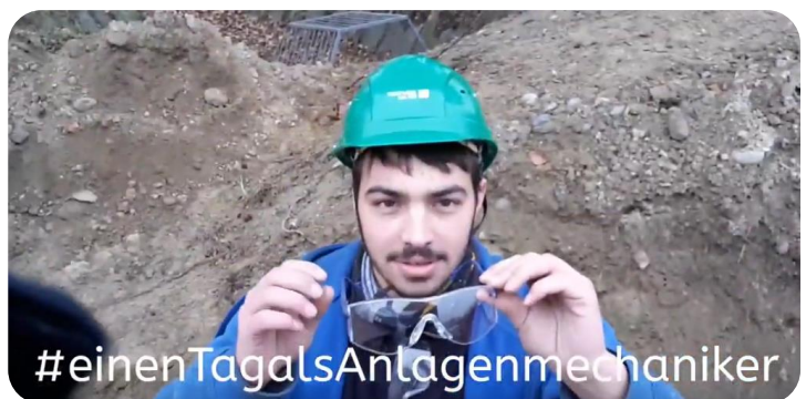
Abbildung 2: Videoclip Anlagenmechaniker Versorgungstechnik