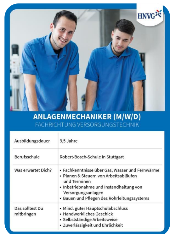
Abbildung 3: Marketingprodukt "Ausbildungsquartett"