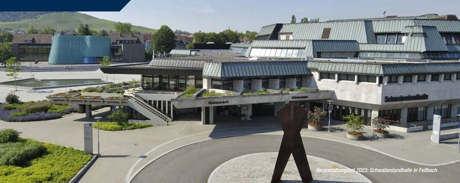
Veranstaltungsort 2023: Schwabenlandhalle in Fellbach