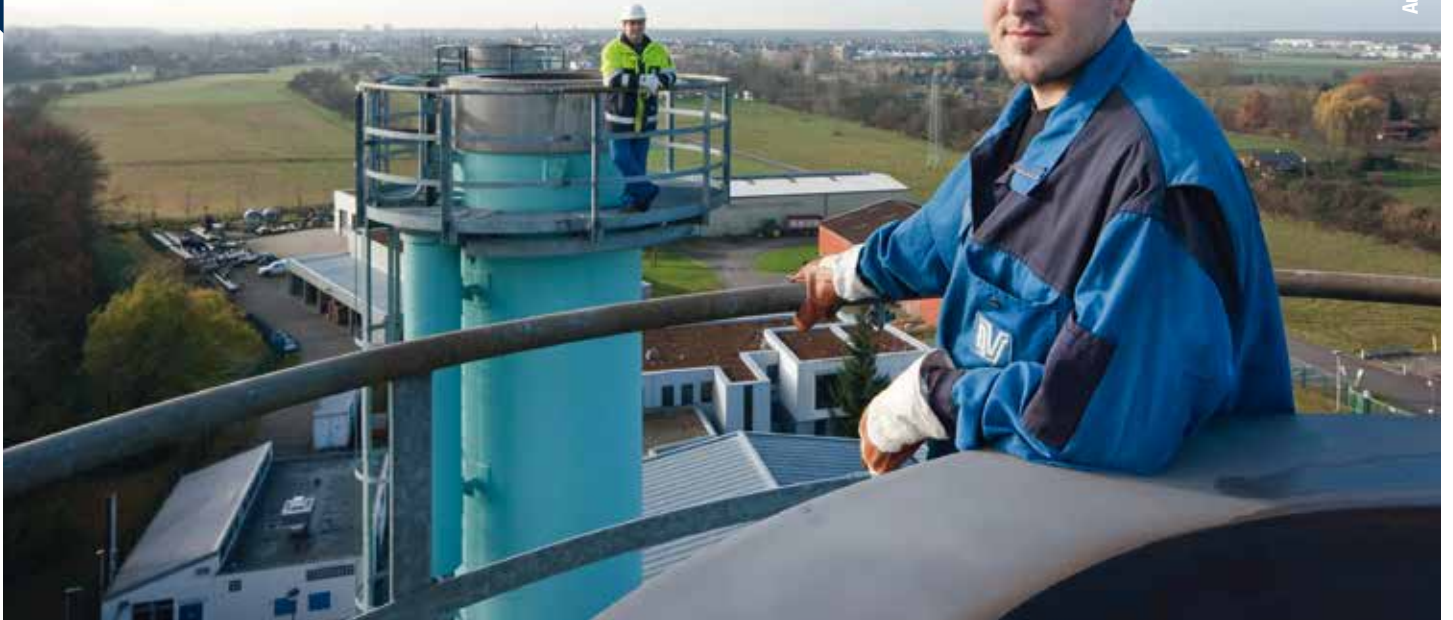
Ausblick von den Kaminen der Verdichterstation

Wassermeister und eines der jüngsten Bezirksgruppenmitglieder und Mitglied der Bezirksgruppe Bremen-Oldenburg