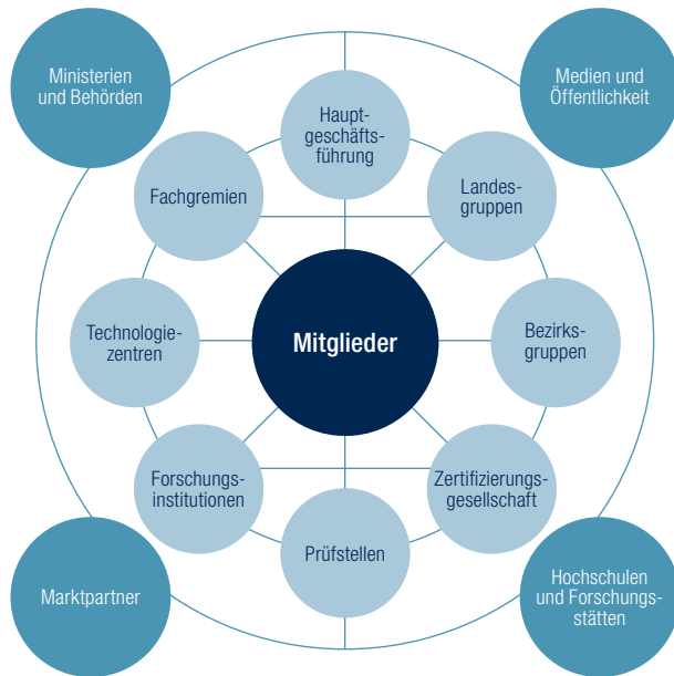
Das Netzwerk des DVGW – auf nationaler und internationaler Ebene

Über die Mitgliederversammlung, die Verantwortung in den Organen des Vereins und vor allem durch die aktive Mitarbeit in den Fachgremien des DVGW können unsere Mitglieder direkt auf die Entwicklung ihrer Branche Einfluss nehmen. Gleichzeitig sorgt die vernetzte und dezentrale Struktur für einen umfassenden und schnellen Informationsfluss im Fach. Der DVGW bietet ein starkes Netzwerk für die Gas- und Wasserversorgung